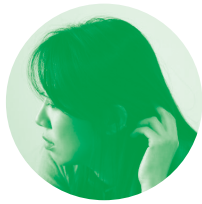
수상한 커튼 | 싱어송라이터