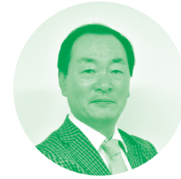
정상천 | 국가균형 발전위원회 위원

일시. 6월 21일(금) 오후 7시 30분 장소. 아람누리도서관(경기 고양시 일산동구 중앙로 1286)