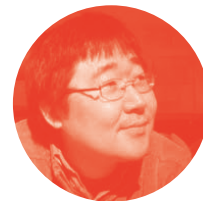
곽재식 | 작가