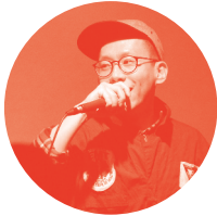
박하재홍 | 음악인, 사회적 활동가