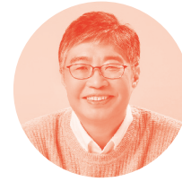
우석훈 | 경제학자

일시. 6월 15일(토) 오후 7시 장소. 삼요소(대전 서구 갈마역로 1, 2층) *참가비 예매 25,000원, 현매 30,000원