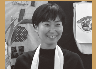
고금속 | 환경활동가