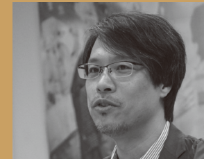
안세홍 | 사진가